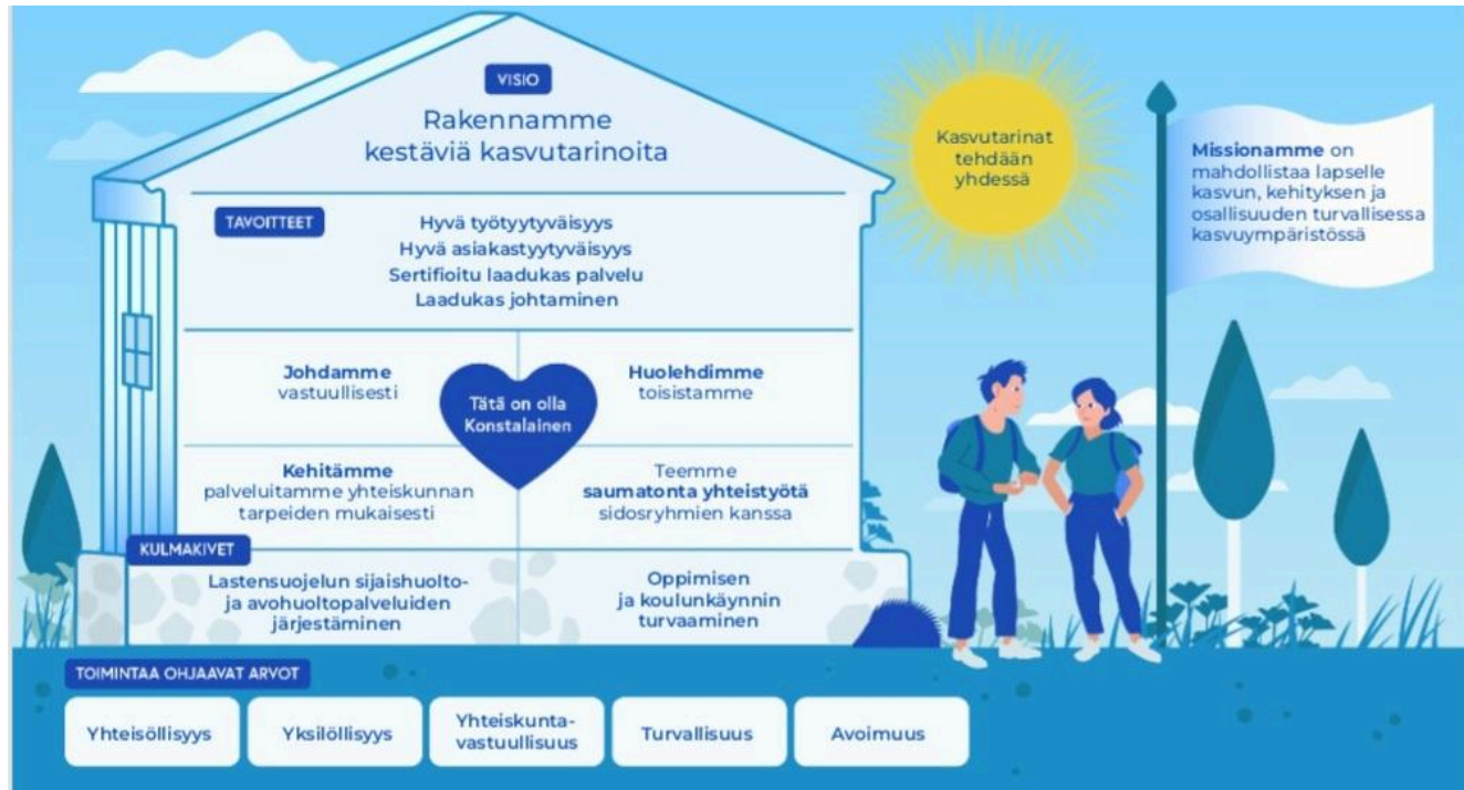
Kuva: Konstan strategikuva

Konstan Koti ja Koulu Oy tuottaa lastensuojelun sijaishuollon ostopalveluja hyvinvointialueille: